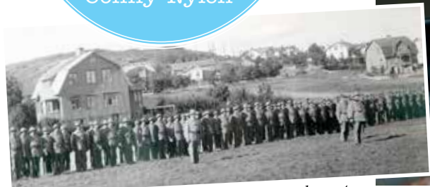
Militärer uppställda på ängen mellan Gamla posten och Bagarns, på Björkö, under andra världskriget.