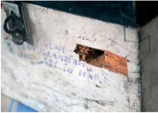
Hål från eldgivning, från pansarskeppet Manligheten, mot lågt flygande flygplan över Mossen på Björkö.